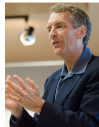
Retroalimentación y Coaching