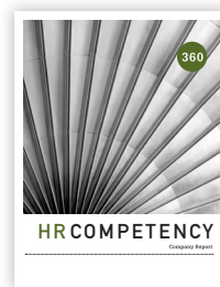
Evaluación e Informe